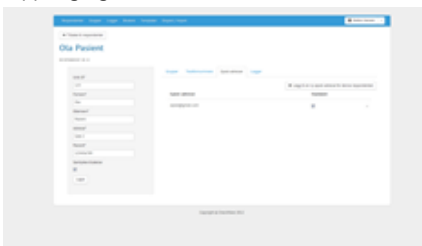
Figur: Enkel oversikt pr. respondent

CheckWare Respondent Manager er en webbasert løsning for import og vedlikehold av identifiserbar informasjon om deltakere i et forskningsprosjekt, og automatiserer oppfølgingen av besvarelser.